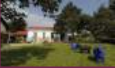
Paul - Gerhardt - Gemeinde