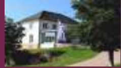
Friederike – Fliedner - Gemeinde